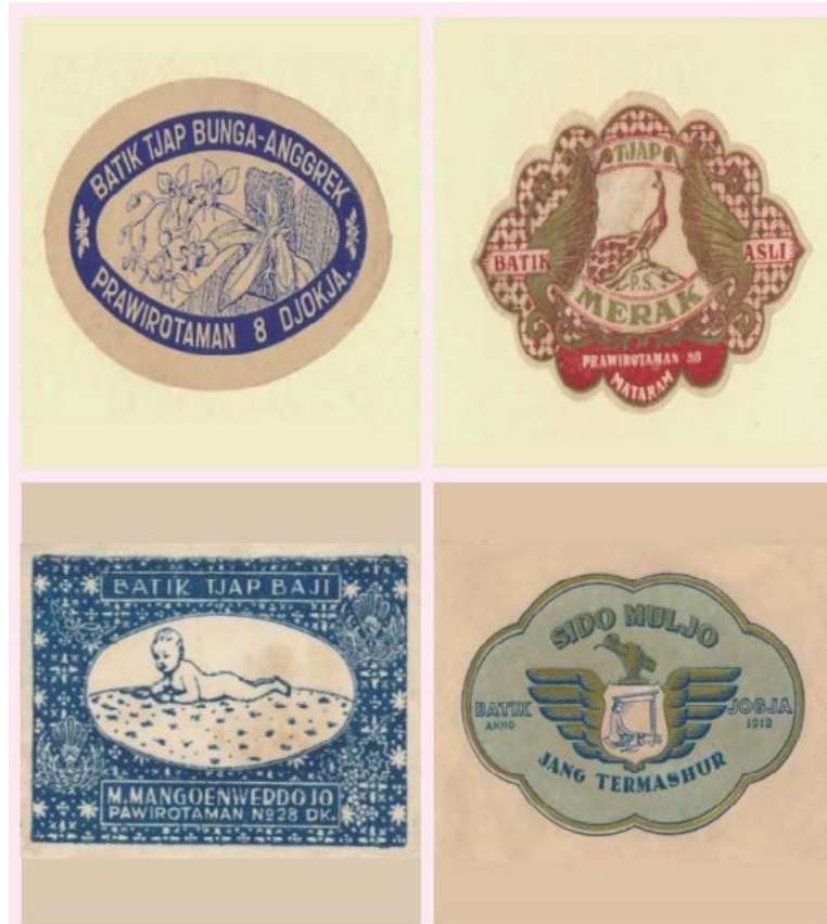
Gambar 2. Beberapa Gambar Etiket Batik Prawirotaman di Masa Keemasannya

Pada periode-periode berikutnya perkembangan batik di kawasan Prawirotaman semakin berkembang. Hal ini juga karena para peminat batik Prawirotaman semakin meluas. Pada awalnya batik yang ada di Prawirotaman hanya digunakan untuk kebutuhan sendiri. Namun, dalam perkembangannya batik menjadi komoditi dagang yang menjanjikan. Industri batik di Prawirotaman semakin berkembang sejak tahun 1950 an (Sumintarsih & Andrianto, 2014: 8990).