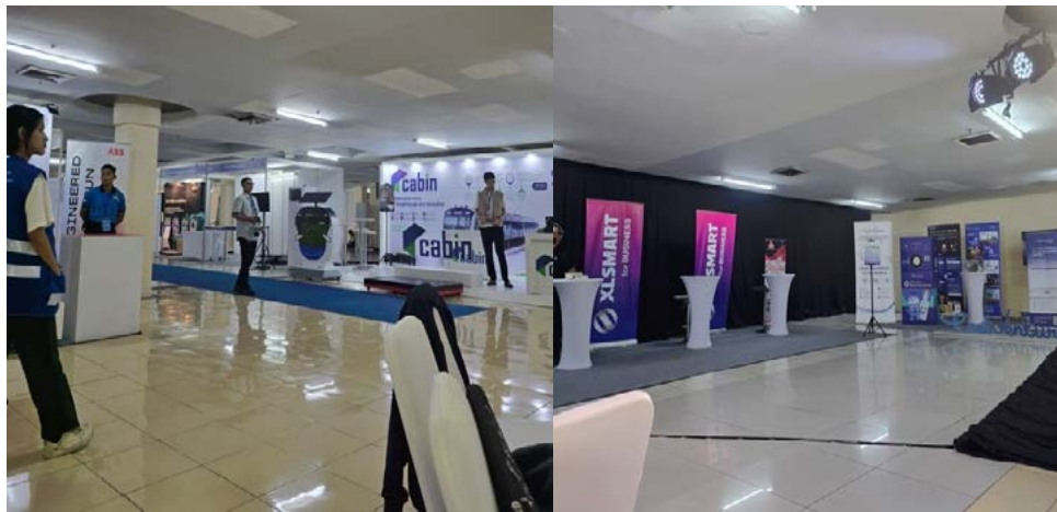
Gambar 2: Penggunaan ruang ada kegiatan Innovation Week 24-26 Mei 2025 .

Selain itu, kemampuan ruang untuk beradaptasi terhadap perubahan kebutuhan komunitas menjadi aspek penting dalam transformasi sosial yang terjadi. Aktivitas komunitas yang bersifat temporer dan dinamis, seperti festival kreatif musiman, pameran pop-up, dan forum diskusi tematik, dapat difasilitasi melalui desain yang mempertimbangkan mobilitas elemen ruang dan kemudahan reorganisasi. Fleksibilitas ini merupakan hasil dari dialog yang intensif antara perancang dan pengguna dalam tahap perencanaan dan implementasi desain.