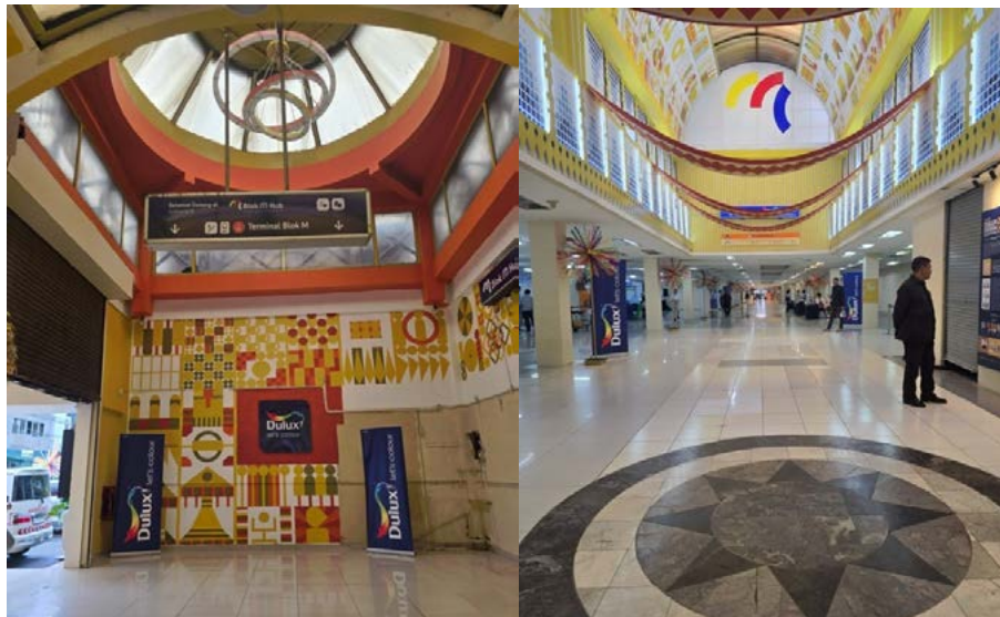
Gambar 4: Ambiance Interior M Bloc. Sumber : Foto:ikayp , Mei 2025

Konsep visual branding yang diterapkan di M Bloc Space tidak bersifat komersial semata, melainkan dimaknai sebagai strategi penguatan karakter ruang. Identitas visual yang dihasilkan bersifat otentik karena lahir dari dialog antar pelaku kreatif dan pengguna, bukan dari formula desain generik. Hal ini menjadikan estetika ruang bukan sekadar bentuk, tetapi juga sebagai representasi nilai-nilai yang diusung oleh ruang tersebut: inklusivitas, keberlanjutan, kreativitas, dan keterhubungan lokal.