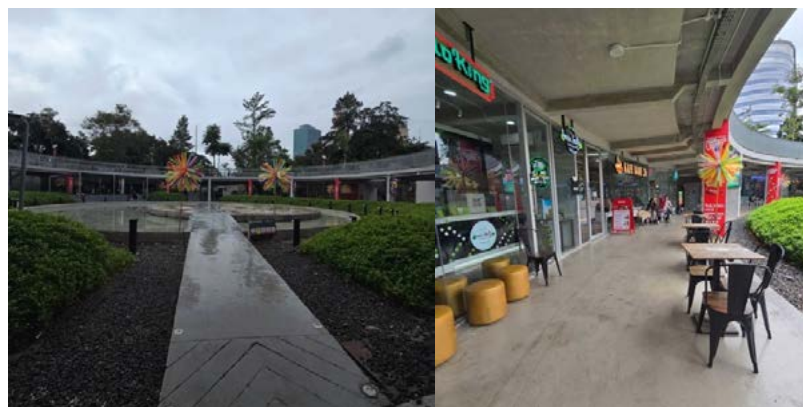
Gambar 4: Area komersial. Sumber : Foto:ikayp , Mei 2025

Elemen visual kontemporer seperti mural komunitas, signage khas dengan tipografi lokal, dan instalasi seni yang dibuat oleh seniman muda Jakarta menjadi bagian integral dari identitas ruang. Proses kurasi elemen-elemen visual tersebut dilakukan secara partisipatif antara arsitek interior, desainer grafis, pelaku seni, serta komunitas kreatif lokal. Partisipasi lintas disiplin ini menghasilkan komposisi visual yang tidak seragam namun harmonis, mencerminkan keberagaman budaya urban dan semangat kolektif dari komunitas pengguna ruang.