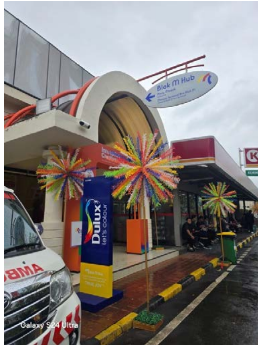
Gambar 3: Entrance. Sumber : Foto:ikayp , Mei 2025

pemanfaatan material reuse dan pendekatan estetika berbasis lokal. Material bekas dari bangunan lama, seperti kayu bekas pintu dan jendela, serta logam dari struktur asli, diolah kembali menjadi elemen interior seperti furnitur, pelapis dinding, dan aksesoris dekoratif. Pemanfaatan ulang ini tidak hanya mengurangi limbah konstruksi, tetapi juga menyisipkan narasi historis ke dalam bahasa visual ruang.