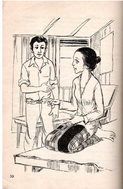
Gambar 3. Visual perwajahan buku Hati Seorang Guru

Konflik yang terjadi dengan ibunya karena perbedaan dalam pandangan mengenai pekerjaan, Jakarta dan cita-cita. Jakarta bagi sang ibu memiliki banyak kesempatan untuk pekerjaan sedangkan Harmanto tidak.