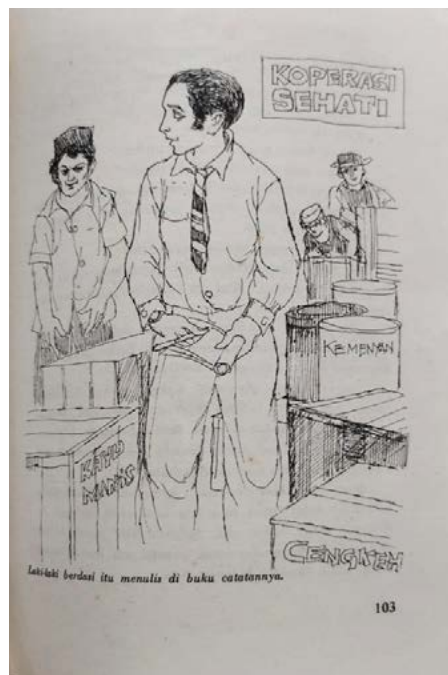
Gambar 1. Visual tokoh utama yang sudah belajar di Jakarta digambarkan menjadi orang kota ditengah-tengah hasil desa; kemenyan, cengkeh, kayu manis

Di dalam cerita ketegangan mengenai desa dan kota terkait dengan citra memusat dan meminggir . Desa sebagai ruang yang terbelakang dibandingkan dengan kota Jakarta karena pendidikan. Orang-orang desa adalah mereka yang buta huruf. Kota Jakarta menjadi jawaban untuk mengembangkan desa dengan tokoh yang harus belajar ke Jakarta. Citra urban digambarkan dengan visual tokoh dari pakaian yang berdasar kontras dengan orang-orang desa.