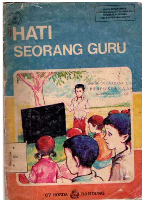
Gambar 3. Visual perwajahan buku Hati Seorang Guru

“Hati Seorang Guru” adalah cerita yang berlawanan dengan “Desa Baru”. Jika dilihat dari perwajahan buku, citra orang-orang kampung/desa terlihat dari gambar seorang guru yang menjar di luar kelas dengan papan tulis. Hal ini menunjukkan bahwa proses pembelajaran di kampung atau desa begitu berbeda dengan yang di kota. “Hati Seorang Guru” bercerita tentang Harmanto seorang guru di Jakarta. Meskipun ia lulusan Sekolah Pendidikan Guru, ia sangat sulit menjadi guru karena persaingan di Jakarta begitu ketat. Meskipun sudah melamar ke sana ke mari di Sekolah Dasar di Jakarta.