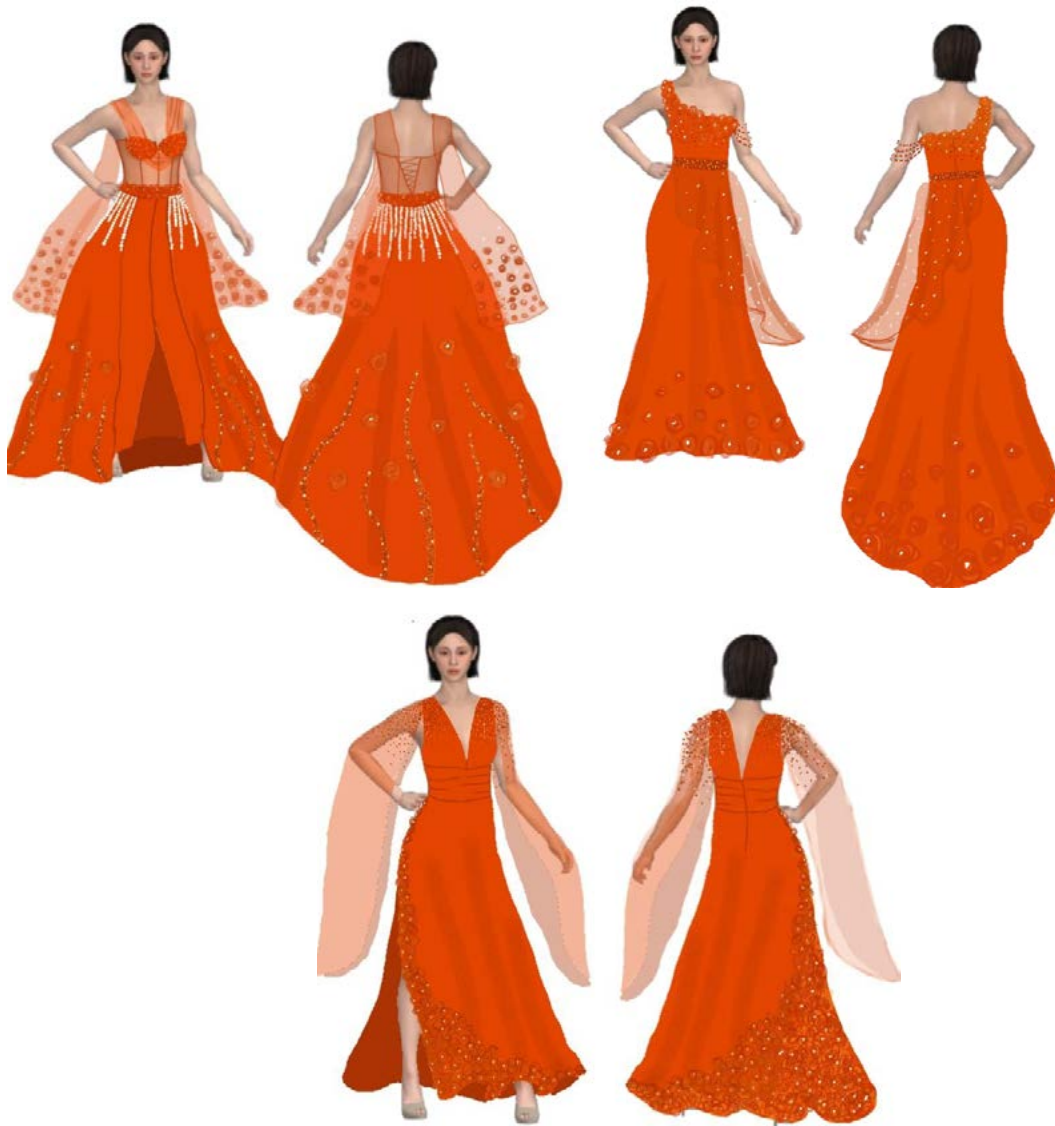
Gambar 3. Desain Busana Agni Hotra