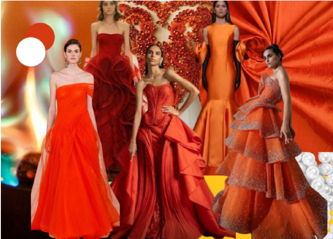
Gambar 2. Mood Board Agni Hotra