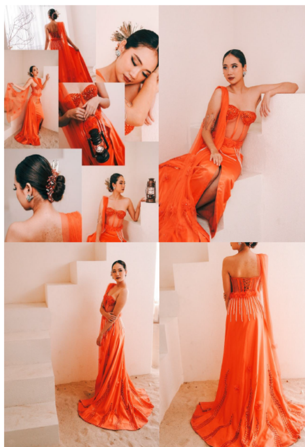
Gambar 6. Busana Agni Hotra

Berikut adalah dokumentasi visual dari hasil akhir busana haute couture bertema Agni Hotra: