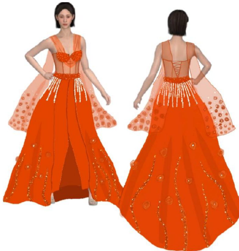
Gambar 4. Selected Design of Agni Hotra

Paduan teknik detail dan simbolisme memperkuat visualisasi naratif spiritual dalam desain ini. Siluetnya menonjolkan tubuh perempuan secara artistik sebagai manifestasi kekuatan dan kemurnian, selaras dengan semangat Agni sebagai simbol energi hidup dan transformasi diri.