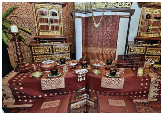
Gambar 10. Table ware dengan motif songket Palembang pada keramik porselen