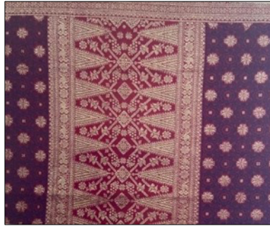
Gambar 3. Songket Tawur (detail). Tenunan dengan tumpal bercorak pucuk rebung dan bidang badan berisi motif bunga yang tersebar ke seluruh permukaan kain.