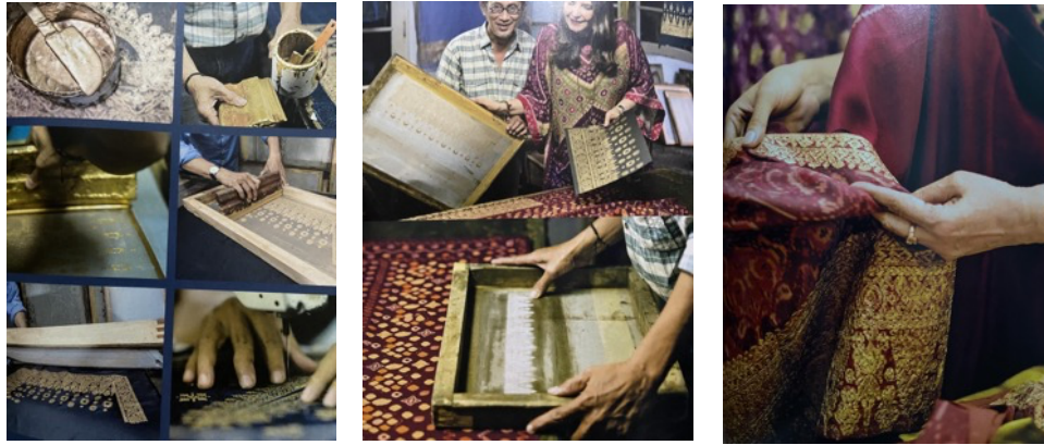
Gambar 9. Teknik cetak sablon motif tenun songket dan motif jumputan