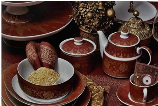
Gambar 13. Table ware dengan motif songket Palembang pada keramik porselen

Ghea juga membuat desain untuk perlengkapan table ware dengan menggunakan pola songket pada keramik porselen. Semua peralatan makan disesuaikan dengan adat istiadat Palembang, termasuk diameter piring makan. Ghea membuat peralatan makan yang merupakan wujud kecintaan terhadap budaya Sumatera yang terinspirasi dari indahnya songket Sriwijaya kuno.