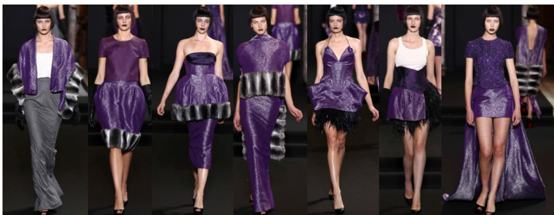
Gambar 15. karya Didit Hediprasetyo songket Indonesia bergaya elegant dan glamour