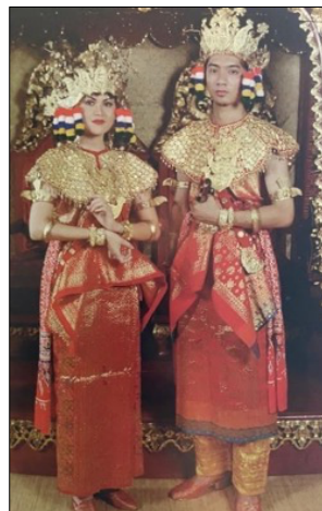
Gambar 5. Tenun Songket sebagai busana adat pernikahan di Palembang