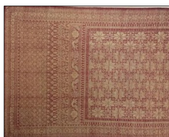
Gambar 2. Songket Lepus , tenunan benang emas. dipakai oleh pengantin wanita pada hari pernikahannya. Sumber: Tenunan Indonesia.hlm.112

Tenun Tapestri dibuat dengan tenunan tangan dengan media alat tenun bukan mesin. Terdapat 2 jenis benang yang menyusun tenun tapestri yaitu benang lungsin dan benang pakan. Kain tenun yang dibuat dengan teknik menambah benang pakan sebagai hiasan, dengan menyisipkan benang perak, emas atau benang warna di atas benang lungsin dianyam secara horizontal. Motif kain dibentuk dengan mengikat dan mewarnai benang pakan (horizontal) di kain sebelum ditenun. Jenis tenun yang dianyam secara vertikal disebut dengan lungsi. Berkebalikan dari pakan tambah, motif di kain-kain lungsi tambah dibuat dari benang-benang lungsi (vertikal) di kain tenun yang sudah jadi. Kain ikat dapat dibedakan dari kain songket berdasarkan jenis benang. Kain yang ditenun dari helaian benang pakan atau benang lungsin yang sebelumnya dikat dan dicelupkan ke dalam zat pewarna alami. Alat tenun yang dipakai adalah alat tenun bukan mesin. Kain ikat dapat dijahit untuk dijadikan pakaian dan perlengkapan busana, uplostery, atau penghias interior rumah. Motif kain songket hanya terlihat pada salah satu sisi kain, sedangkan motif kain ikat terlihat pada kedua sisi kain.