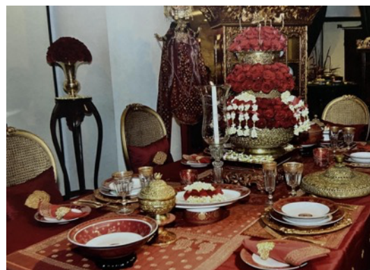
Gambar 11. Table ware dengan motif songket Palembang pada keramik porselen