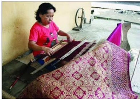
Gambar 4. Perajin tenun songket Palembang

Tenun songket adalah selembar kain terjadi karena proses persilangan benang-benang memanjang ( lungsi ) dan melebar ( pakani ) berdasarkan suatu pola anyaman tertentu dengan bantuan alat tenun. Semakin rumit pola anyaman, semakin beragam pula tampilan permukaan pada latar kain. Masyarakat penenun Indonesia secara turun-temurun telah mengembangkan kemahiran menenun. Beragam rupa dan bentuk alat tenun memperkaya khazanah kebudayaan bendawi di Nusantara. Cara bekerja dari alat-alat tenun yang digunakan perajin tenun Indonesia, secara mendasar tidaklah terlalu berbeda (Anas, 1995:31).