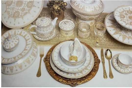
Gambar 12. Table ware dengan motif songket Palembang pada keramik porselen