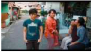
Gambar 172. Referensi Setting