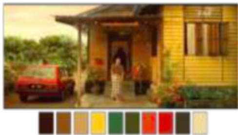
Gambar 197. Referensi Color Palette

Seperti warna, pencahayaan adalah faktor pendukung ruang yang sangat penting, lighting dalam sebuah gambar/film. Lighting hadir tidak sekedar untuk menerangi set dan aktor. Lighting dapat menentukan mood (suasana) suatu adegan. Bayangkan jika adegan pengusiran setan di film The Conjuring menggunakan lighting terang benderang yang datar, tentu mood menakutkan tidak bisa dirasakan penonton. Bagi para sutradara, pencahayaan itu lebih dari sekedar penerangan untuk dapat melihat set dan aktor. Pencahayaan digunakan untuk memberi arti lebih tentang seorang karakter atau situasi lewat aksennya. Pencahayaan yang baik dapat dicapai dengan manipulasi dan arah tembakan cahaya.