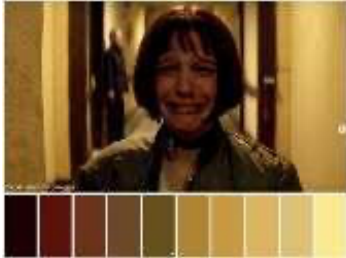
Gambar 7. Ilustrasi pemilihan warna analogus

Penggunaan konsep Tetradic complementary merah- ungu, hijau-kuning digunakan dikarenakan adanya dominasi pada para tokoh yang juga mencerminkan dan menunjukkan sifat mereka. Warna-warna ini juga termasuk warna hangat dimana memasukan color palette yang sudah ditentukan agar memiliki look dan mood pada tahun yang ditentukan yaitu sebelum era tahun 2010. Warna ini digunakan pada artistik sendiri dikarenakan warna warm yang digunakan pada sinematografi tidak menonjol seperti warna yang dipilih untuk artistik sendiri maupun dari lingkungan hingga kepada properti yang digunakan berdominan kepada warna-warna tersebut, seperti celengan ayam yang berwarna merah dan kuning atau nantinya adanya tanaman yang berwarna hijau.