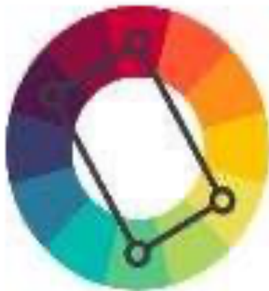
Gambar 8. Ilustrasi pemilihan warna Treadic complementary

Penggunaan konsep Tetradic complementary merah- ungu, hijau-kuning digunakan dikarenakan adanya dominasi pada para tokoh yang juga mencerminkan dan menunjukkan sifat mereka. Warna-warna ini juga termasuk warna hangat dimana memasukan color palette yang sudah ditentukan agar memiliki look dan mood pada tahun yang ditentukan yaitu sebelum era tahun 2010. Warna ini digunakan pada artistik sendiri dikarenakan warna warm yang digunakan pada sinematografi tidak menonjol seperti warna yang dipilih untuk artistik sendiri maupun dari lingkungan hingga kepada properti yang digunakan berdominan kepada warna-warna tersebut, seperti celengan ayam yang berwarna merah dan kuning atau nantinya adanya tanaman yang berwarna hijau.