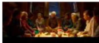
Gambar 180. Referensi Komposisi (Sumber : Ngeri-Ngeri Sedap )

Gambar 3. Ilustrasi pengambilan sudut kamera.