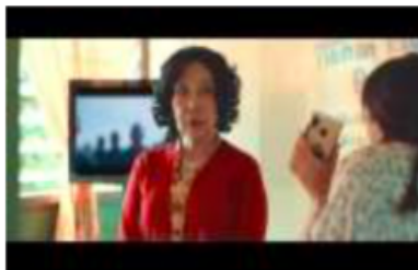
Gambar 175. Referensi Make Up

Kostum dan unturnya seperti styling , pilihan bahan, dan warna mampu menunjukkan suatu era waktu di lokasi tertentu. Untuk tujuan ini, jelas dibutuhkan riset yang detail. Fungsi lain kostum adalah mempertegas naratif, misalnya posisi sosial seorang karakter. Sebagai contoh, tekstur kain katun dan kain sutra tentu punya dua makna yang berbeda.