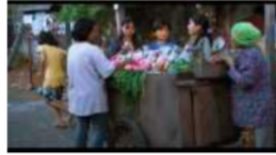
Gambar 174. Referensi Setting