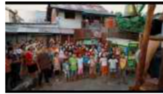
Gambar 179. Referensi Komposisi