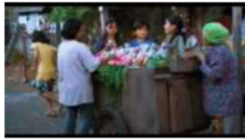
Gambar 178. Referensi Komposisi

membuatnya tampak lebih rentan dan lemah. Film 527 memiliki total 15 scene yang terbagi atas 10 scene exterior day , 3 scene interior day , 1 scene interior night , dan 1 scene exterior night