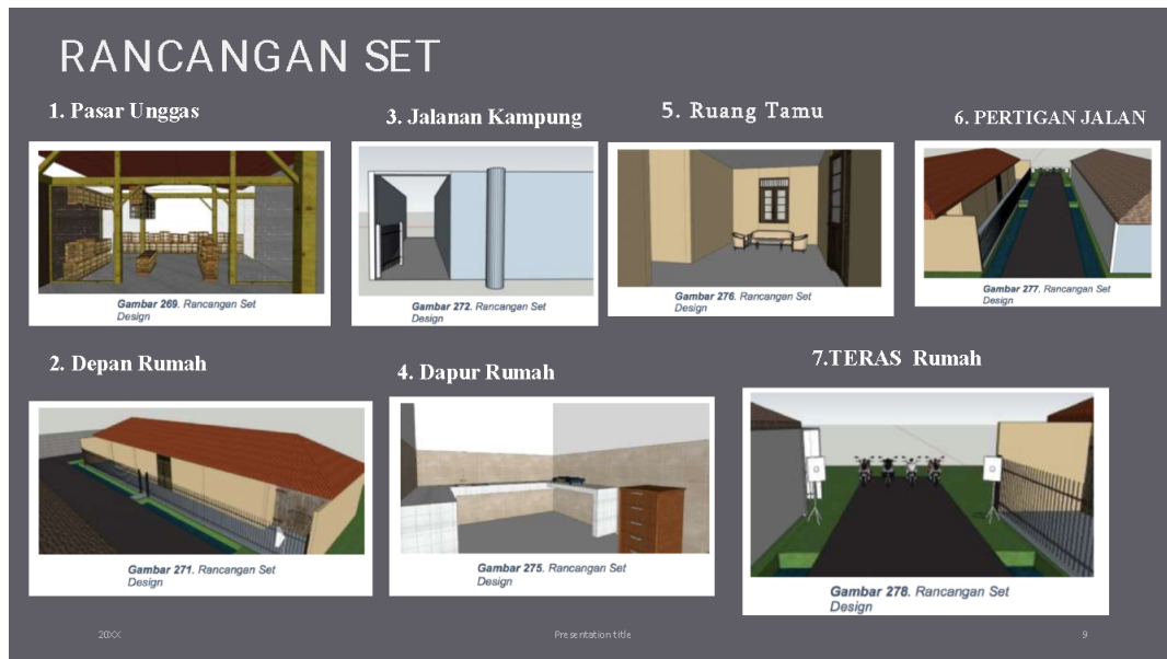
Gambar 1. Ilustrasi gambar interior