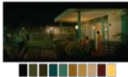
Gambar 198. Referensi Color Palette

Gambar 5. Ilustrasi pengambilan contoh warna.