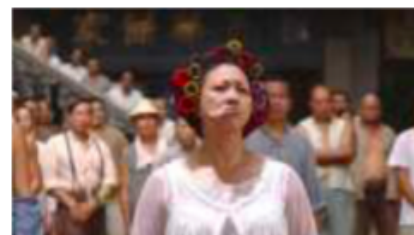
Gambar 176. Referensi Hair Style

Gambar 4. Ilustrasi pemilihan desain kostum