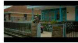
Gambar 173. Referensi Setting