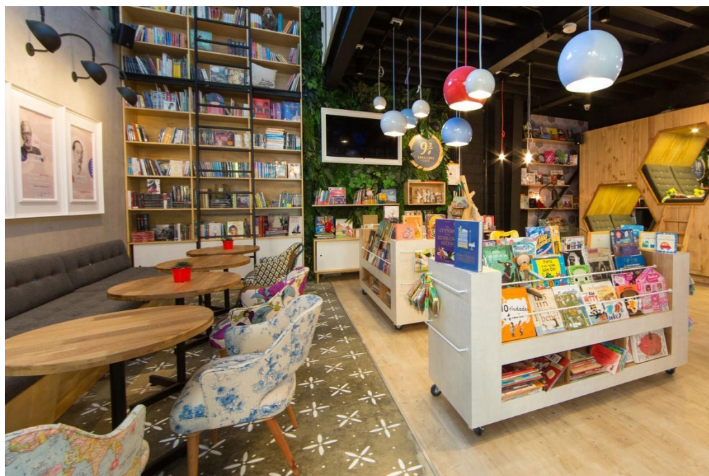
Gambar 4. Hibriditas fungsi ruang 9 and Three Quarters Bookstore Café

Studi kasus ketiga mengambil proyek toko buku dan café yang berada di Antioquia, Colombia. Target market adalah anak-anak dengan orang tua yang dapat menikmati fasilitas dan suasana yang dihadirkan. Tempat pertemuan yang hangat dan menyenangkan bersama keluarga dan teman, dihadirkan pada tempat ini. Orang dewasa dapat mengawasi anak-anak mereka sambil bersantai dan bertemu dengan relasi. Gaya hidup, yang menggabungkan toko buku anak-anak dan kafe menciptakan lingkungan hibriditas yang memadukan kesenangan dan kehangatan keluarga dengan kebutuhan dan selera orang dewasa.