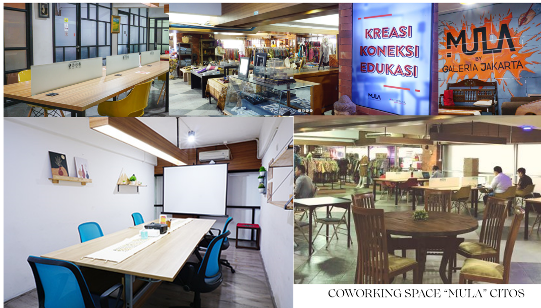
Gambar 1. Co-working space MULA by Galeria Jakarta

Demikian pula, ruang ritel telah bertransformasi menjadi zona pengalaman dan bukan sekedar tempat transaksional. Konsumen perkotaan mencari lebih dari sekedar produk; mereka mendambakan pengalaman yang imersif dan interaktif. Gerai ritel kini berfungsi sebagai ruang untuk demonstrasi produk, yang menumbuhkan rasa hubungan antara merek dan konsumen ritel tradisional.