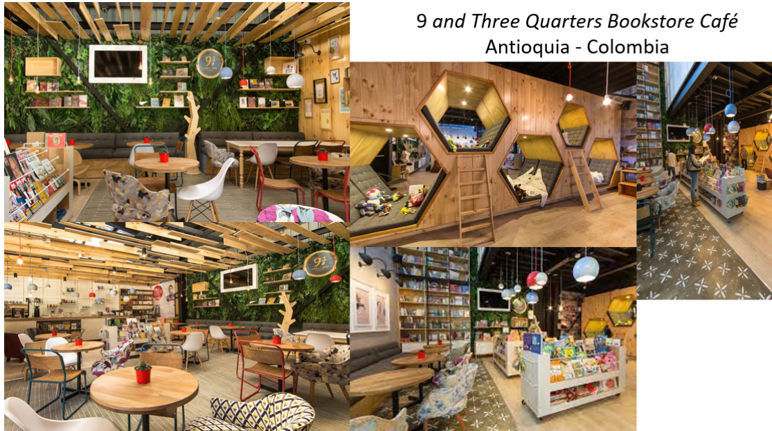
9 and Three Quarters Bookstore Café Antioquia - Colombia