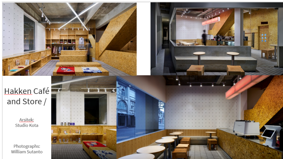
Gambar 2. Interior Hakken Café and Store

Seperti halnya MULA by Galeri Jakarta, tempat ini juga menjadi alternatif aktivitas bersantai, bekerja, dan koleksi ritel barang bekas berkualitas. Akan tetapi yang membedakan adalah fasilitas duduk dan meja dibuat tidak nyaman di lokasi pertama. Area duduk dan meja didesain untuk aktivitas yang tidak nyaman dengan harapan pengunjung tidak duduk lama, dan meja dengan diameter kecil hanya untuk meletakkan cangkir kopi atau piring kue (lihat gbr.2). Aktivitas kerja sebatas diskusi atau mencatat dengan peralatan fungsional seperti agenda atau tablet yang dipegang, bukan diletakan di atas meja seperti laptop.