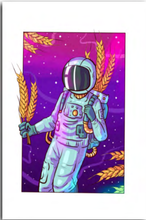
Gambar 4: Zul Fiqhri – Jabat Pangan Farm into space #1_A3_Digital Art_2020