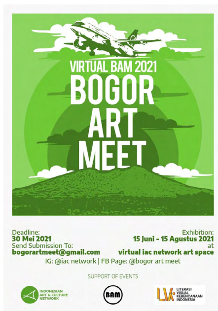
Gambar 1. Poster Undangan