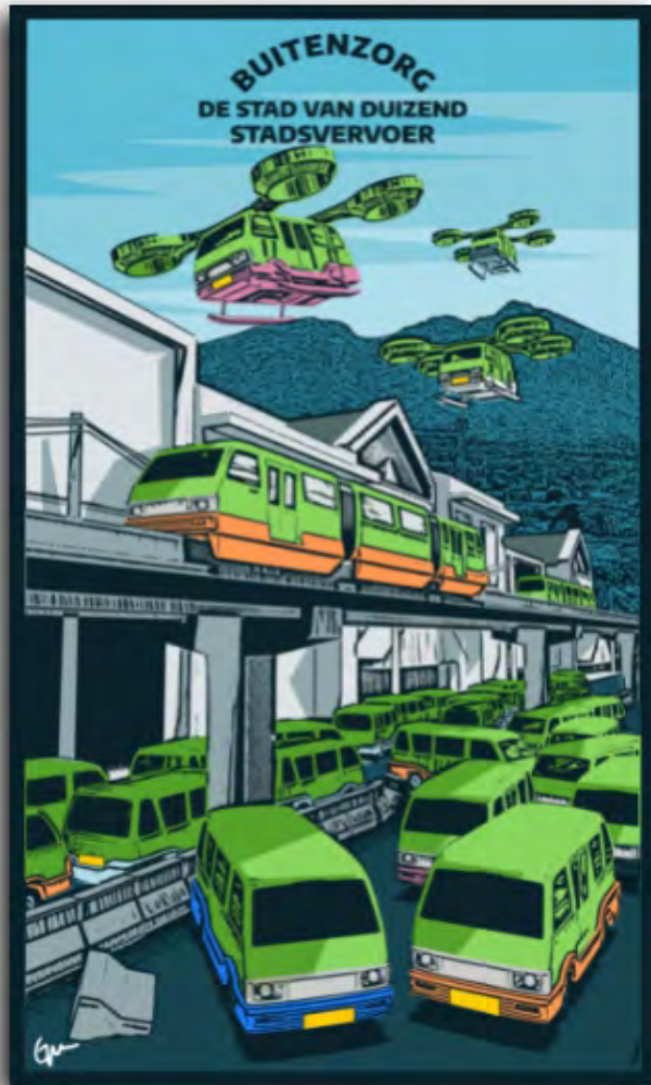
Gambar 2: Degowang Buitenzorg-de stad van duizend stadsvervoer_2000x1400px_Digital Vector_2021