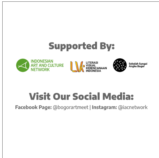
Gambar 5-6